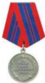
Медаль «За отличие в охране общественного порядка»

Не тут-то было. Пара фирменных приёмов – и вот уже двое взломщиков, размахивающих молотками, отброшены. Ещё удар –