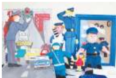
Конкурс кукол «Полицейский дядя Стёпа»

По фамилии Степанов И по имени Степан, Из районных великанов Самый главный великан.