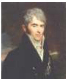
В.П. Кочубей. Худ. Ф. Жерар, 1809 г.

В 1802 году по указу императора Александра I в России было учреждено Министерство внутренних дел. Перед ним поставили задачу «печись о повсеместном благосостоянии народа, спокойствию, тишине и благоустройстве империи». Первым министром внутренних дел стал Виктор Павлович Кочубей (1768–1834), близкий друг императора. Тогдашнее МВД занималось не только охраной общественного порядка, но и некоторыми хозяйственными делами, например, ведало почтой и телеграфом.