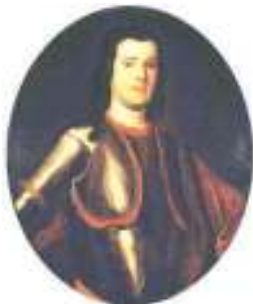
А.М. Девиер. Портрет работы неизвестного художника, XVIII в.

Первым петербургским генерал-полицмейстером был назначен любимец Петра I Антон Мануилович Девиер. Полицейские под его командованием не только следили за порядком, но и занимались благоустройством: мостили улицы, убирали мусор, осушали болотистые места. По инициативе Девиера в столице были поставлены первые фонари и скамейки для отдыха, организована пожарная служба. Но ввёл он и строгости, которые нам сейчас кажутся чрезмерными. Например, въезд в город и выезд из города разрешался только по паспортам, выдаваемым полицией. Учредили ещё и что-то вроде комендантского часа: вечером все улицы перекраживали шлагбаумами, ставили стражу, и ходить по городу могли только военные, священники и женщины, которые принимали роды – повивальные бабки, а всех прочих петербуржцев, желавших белыми ночами прогуляться по улицам, ловили и били кнутом.