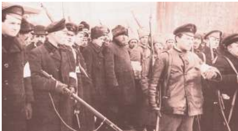
Конвоирование городских. Фото Я. Штейнберга, 1917 г.

Останавливать этот мутный вал пришлось уже новой милиции, созданной после Октябрьской социалистической революции.