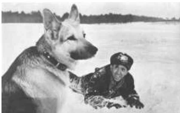
Кадр из фильма «Ко мне, Мухтар!»

Прообразом книжного и киношного Мухтара послужила легендарная ищейка – немецкая овчарка Султан из Ленинградского уголовного розыска. За 10 лет – с 1937 по 1947 год – она помогла задержать более 2 тысяч преступников, обнаружила огромное количество похищенного имущества.