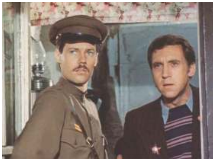
Кадр из фильма «Место встречи изменить нельзя»

Нет. Оказывается, действительно орудовала в Москве такая банда. Она была разгромлена МУРом в начале 1945 года. Но слухи о «Чёрной кошке» ещё долго гуляли по городу. Преступники специально распускали их, чтобы запугать народ якобы существующей сильной бандой.