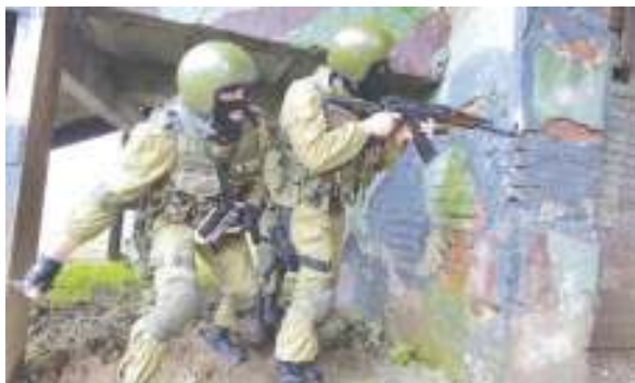
ОМОН в бою