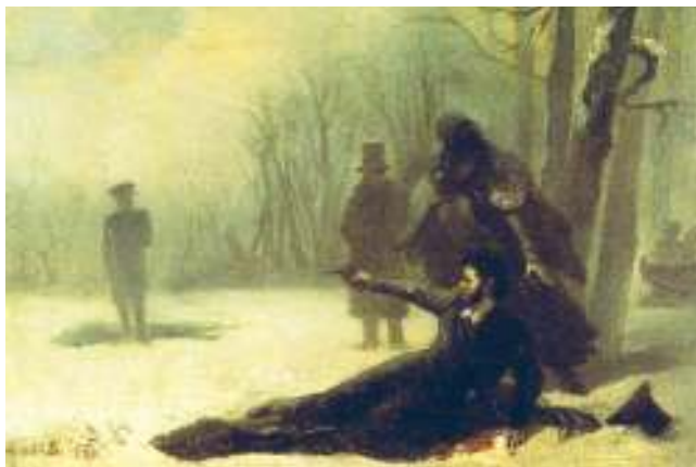
Последний выстрел А. Пушкина. Худ. А. Волков, 1860 г.

Но ведь пуля – не орешек. Попав в пуговицу, она должна была, по крайней мере, её деформировать. Между тем в материалах военно-судебной комиссии, рассматривавшей обстоятельства роко-