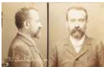
А. Бертильон (автопортрет)

В криминалистике – система описания внешности человека с помощью стандартизированного набора характеристик. Слово «стандартизированного» здесь имеет особый смысл. Дело в том, что разные люди, описывая внешность одного и того же человека, могут вкладывать в свои характеристики разный смысл. Например, кто-то скажет про человека, что он среднего роста. А что это означает на самом деле? Для кого-то средний рост – 165 см, а для кого-то это почти 180. Точно так же по-разному могут быть описаны разными людьми черты лица, цвет глаз, походка, мимика и прочее. При таком подходе inevitably возникают недоразумения и ошибки.