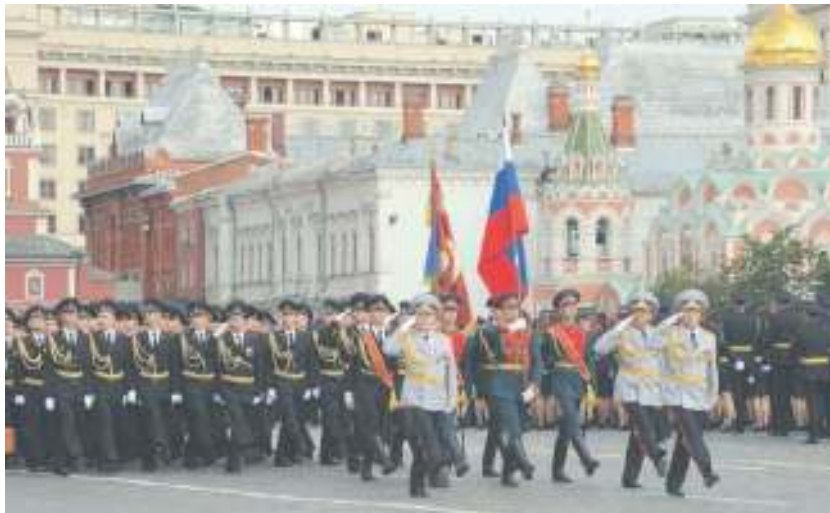
Торжественный марш выпускников Московского университета МВД России

«Вы получили великолепное профессиональное образование. Но в профессии полицейского мало быть специалистом и всецело