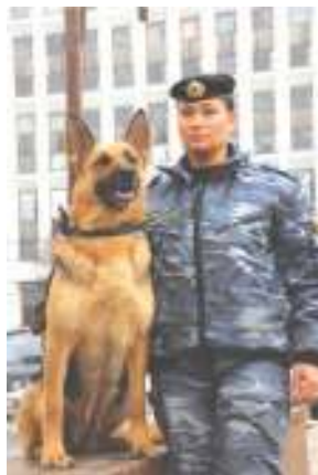
Кинолог со служебной собакой.

Чем умнее пёс, тем разнообразнее модуляции его голоса. Туповатый и лает как-то тупо, однообразно, а умница заливается на все лады, показывает свой темперамент. Сверкающие, живые глаза, быстрые движения – верный признак живого характера и храбрости. И наоборот, если взгляд собаки равнодушен, неуверен и неопределён, то она глупа, ленива и для полицейской службы не годится. Слишком живой темперамент всегда можно обуздать