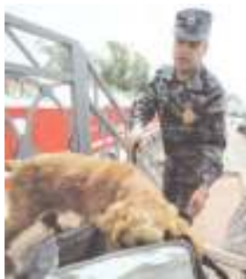
Кинолог за работой.

умелой дрессировкой, а вот привить его или воспитать в собаке невозможно.