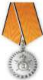
Медаль «За разминирование»

Мужество, отвага и высокий профессионализм российских полицейских отмечаются государственными наградами. С гордостью носят полицейские и награды, учреждённые Министерством внутренних дел России. В числе этих наград медали «За воинскую доблесть», «За доблесть в службе», «За отвагу на пожаре», «За отличие в службе» (трёх степеней), «За разминирование», «За боевое содружество».