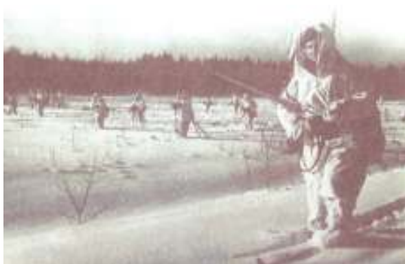
Лыжный отряд милиционеров-добровольцев

Главные силы гитлеровцев были нацелены на Москву. Московская милиция направила на фронт несколько тысяч своих сотрудников. В обороне столицы участвовали четыре дивизии, две бригады и несколько отдельных частей Народного комиссариата