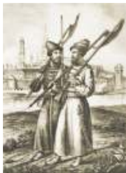
Стрельцы. Гравюра XIX в.

О созданной в Санкт-Петербурге Полицмейстерской канцелярии впервые упоминается в царском указе от 20 мая 1715 года. Эту дату можно считать днём рождения российской полиции. О её предназначении хорошо было сказано в другом документе Петровской эпохи: «Полиция есть душа гражданства и всех добрых порядков и фундаментальный подпор человеческой безопасности и удобности».