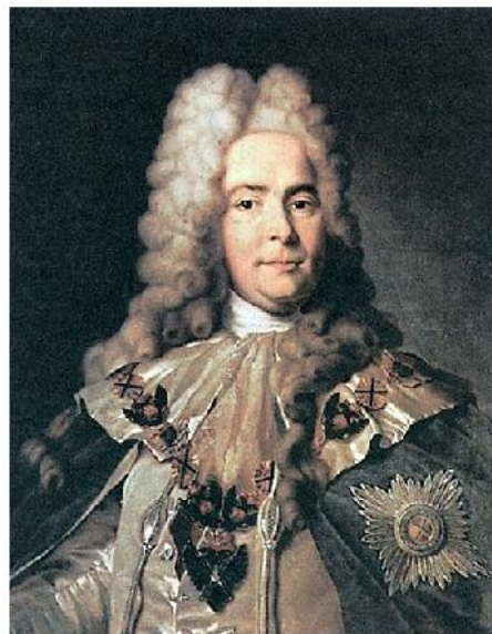
Ягужинский П. И.

Контроль над деятельностью Сената – «око государево»