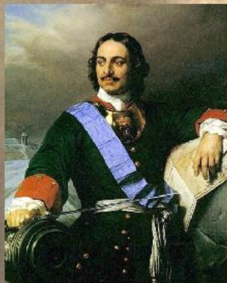
Петр I учредил прокуратуру

С 1996 года 12 января отмечается в России как День работника прокуратуры.